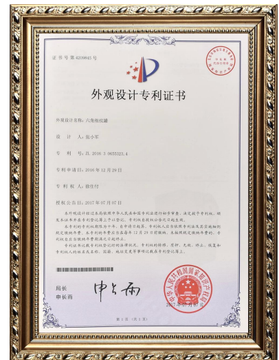
براءة اختراع رقم: 201630655323.4