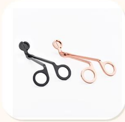
Wick Trimmer Cutter