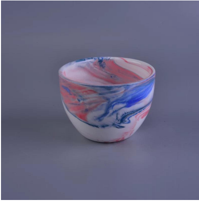
الزخرفية اليدوية الصويا الشمع الشمع المعطرة السيراميك جرة