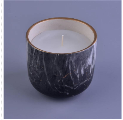
الرخام الشموع المعطرة في السيراميك شمعة جرة مع الرخام صائق الطباعة