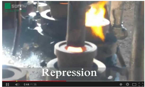
تكنولوجيا الصحافة الميكانيكية