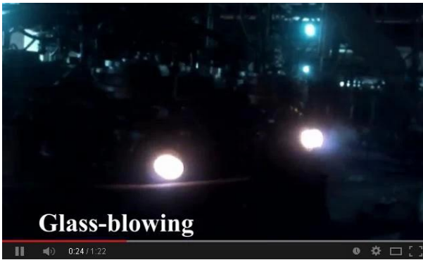
تكنولوجيا نفخ الآلة

بموجب هذا، شاهد فيديو خط الإنتاج الخاص بنا عبر الإنترنت، مرحباً بزيارتنا في الموقع.