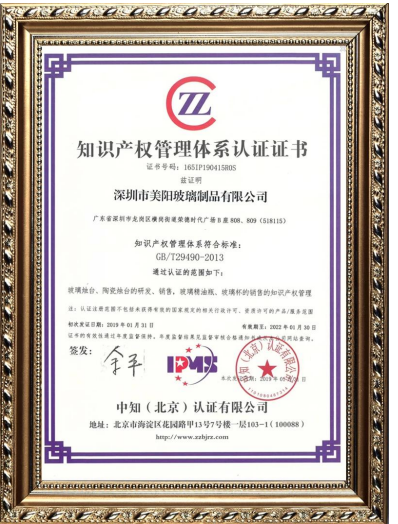
الملكية الفكرية للشركات