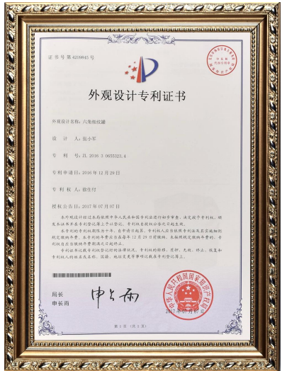
براءة اختراع رقم: 201630655323.4